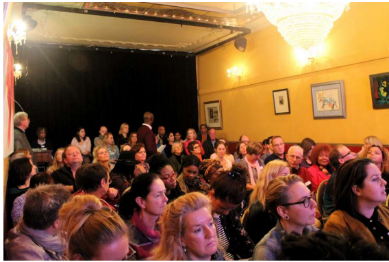
Prijzuitreiking Write & Unite 2016