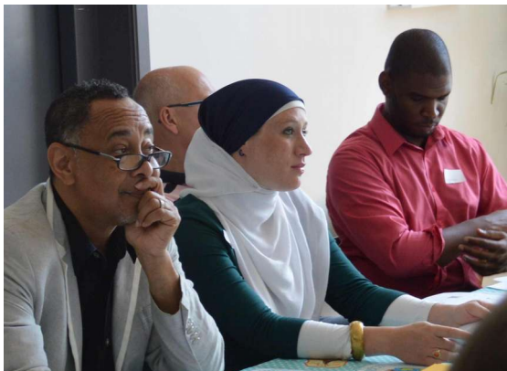
Schrijfworkshop “Hoe maak ik mijn kinderverhaal nog mooier?” juli 2014

Schrijfworkshops voor aspirant-auteurs en creëren de kans, via Write & Unite, om een uitgegeven auteur te worden.