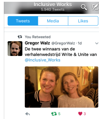
Winnaars Write & Unite 2016

Voeren onderzoek uit om structurele beperking die de participatie van minderheden belemmeren zichtbaar te maken, zoals Eerlijk Zeggen!